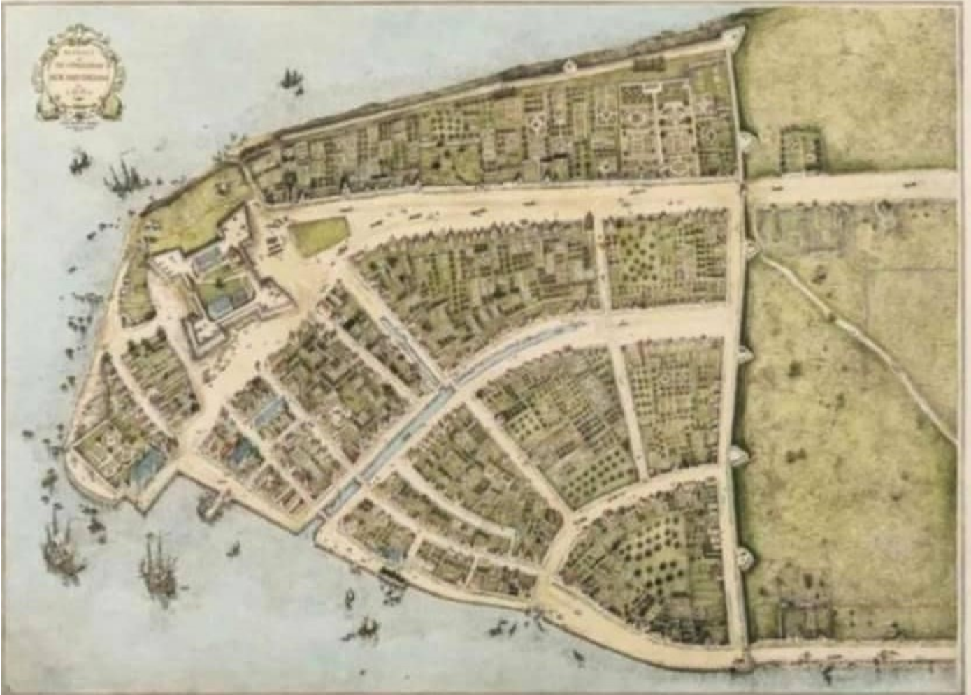
New Amsterdam 1660